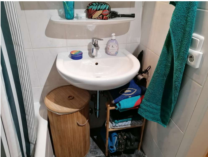
Bad Bild 1